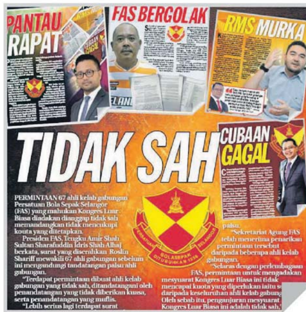
Keratan akhbar mengenai isu EGM sebelum ini.