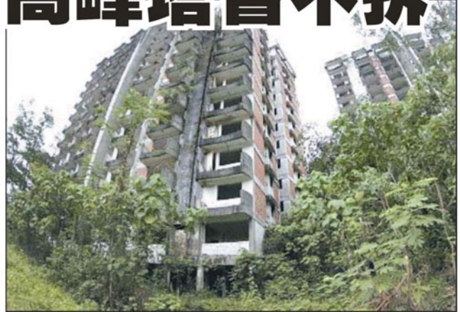
已成废墟的淡江高峰塔，原定重建为休闲公园，惟因有户主打算争取赔偿，拆除计划暂时展延。

事发后，另外2栋公寓，也被判定为危楼，最终超过70户居民被迫无偿搬迁，荒废多年的建筑成为瘾君子 and 流浪汉聚集之地，不复往日荣景。