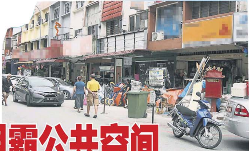
部分地方政府允许店家租用店前五脚基或是泊车格做生意, 前提是不能完全阻挡民众通行。

他们指出, 有些公共空间不阻他人进出, 政府应开放供小贩申请使用, 让他们有合适的地方自食其力地找三餐。 有者认为, 强硬手段对付小贩, 只会令人对政府反感。