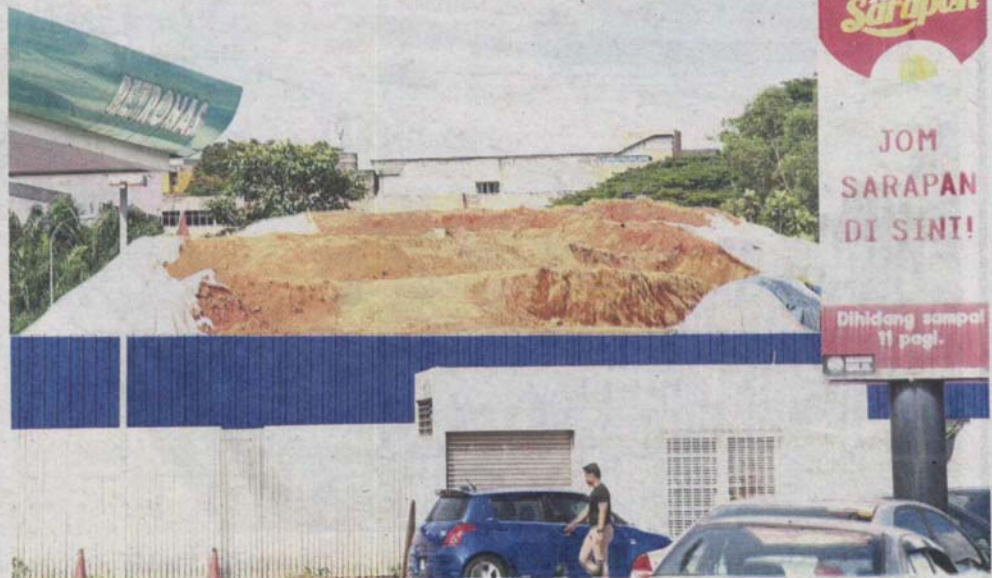
The UiTM station (Station 14) for the LRT3 is located between the Petronas and Shell station area (KL bound) along the Federal Highway

The size of the station will also be reduced from the original 120m