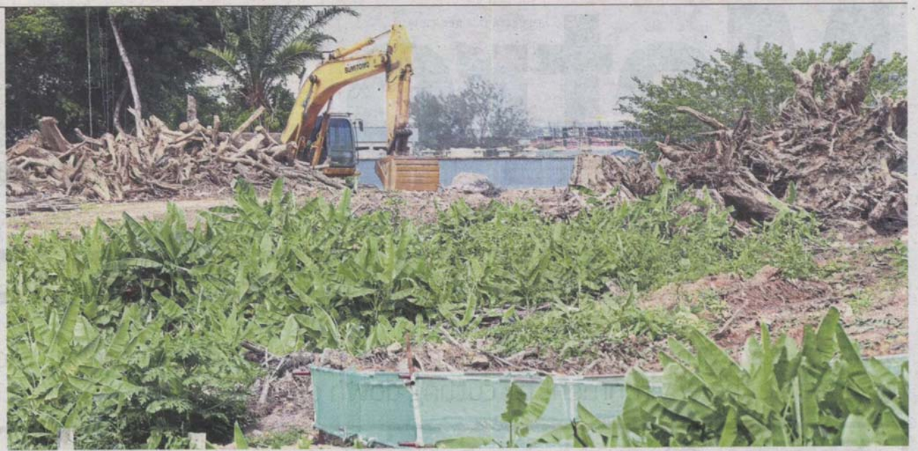
Land clearing for the Sirim stop (Station 13) of the LRT3 project has now stopped as the station is only a provisional one following the Finance Ministry's LRT cost-optimisation exercise.