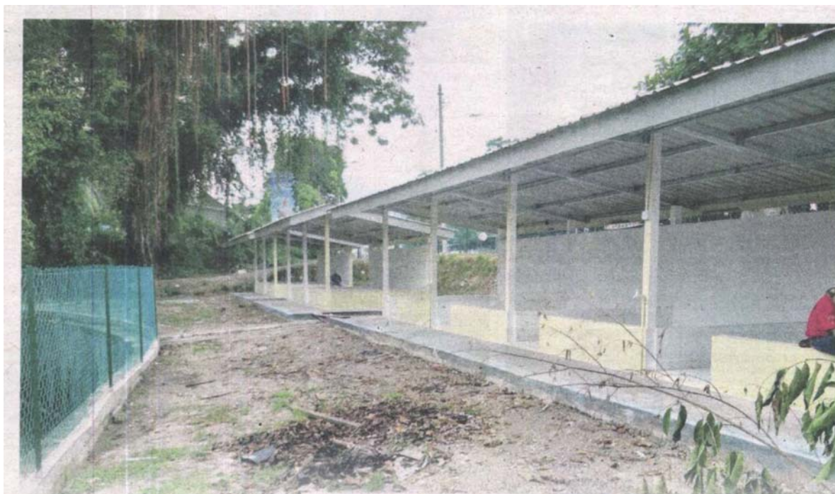
TAMAN Rekreasi Kucing MPAJ yang didakwa akan beroperasi sebagai Pusat Khidmat Rakyat di Jalan Kerja Ayer Lama, Ampang Jaya, Selangor.