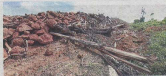
A covered elevated pedestrian bridge linking the carpark across the Federal Highway to the Sirim LRT3 Station (Station 13) along the Federal Highway.