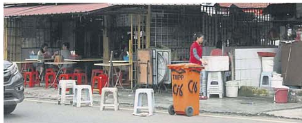
房政部修正法案, 严惩占用公共空间者, 包括路边的空间。