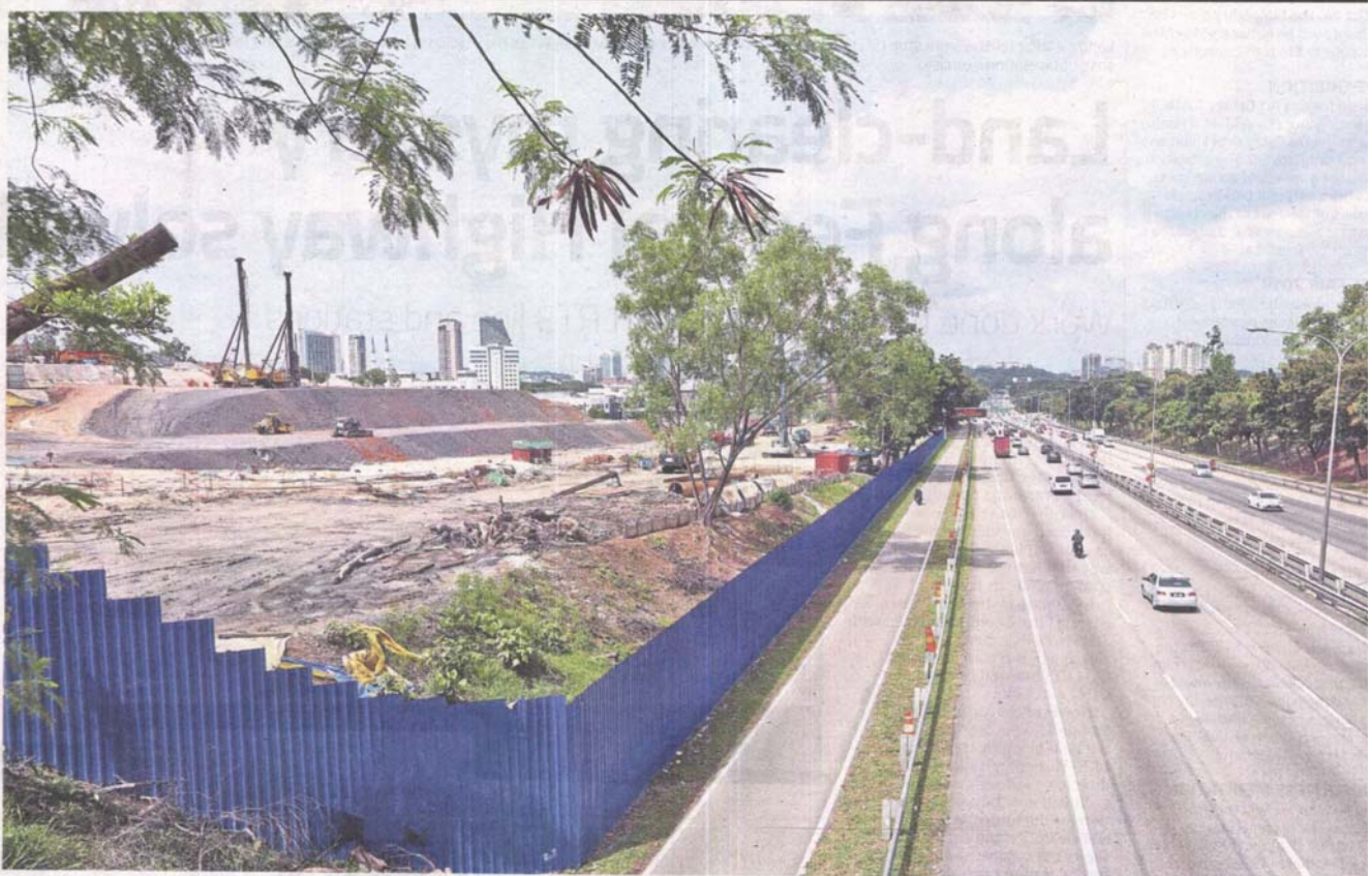
Ongoing project: The site of the shelved Sirim station or Station 13 of the LRT3 project in Shah Alam as seen from the Federal Highway. > 2 — IZZRAFIQ ALIAS/The Star