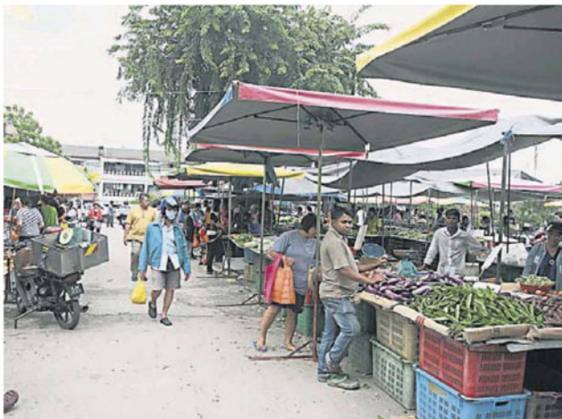
太子园空地巴刹将重建地基, 让消费者更舒适买菜。