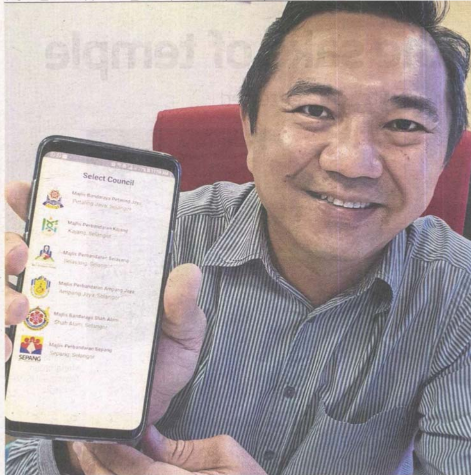
Ng displaying the Smart Selangor Parking App (SSPA), which has the list of all the participating areas on his mobile phone.