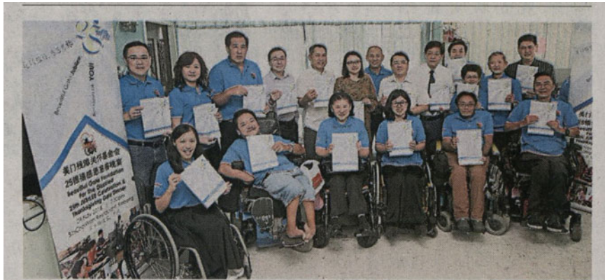
■美門殘障關懷基金會理事呼籲公眾支持感恩慶典晚會，協助基金會籌募2019年營運經費。